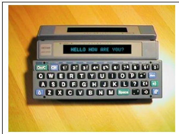
Figuur 2. De Lightwriter.

Een uitstekend voorbeeld is de Lightwriter, een superieur communicatiehulpmiddel dat in de jaren '80 met de engelse ontwerpprijs werd bekroond. Het werd ontwikkeld door Toby Churchill, een man die na een hersenvliesontsteking zijn stem niet meer gebruiken kon. Vele malen heeft hij gesteld in nauwe samenwerking met de doelgroep tot zijn beste ideeën te komen.